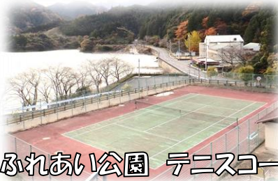
ふれあい公園 テニスコート