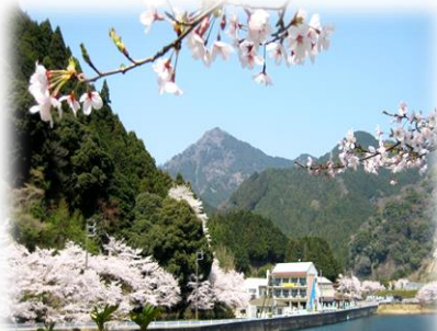
錫杖湖水荘 錫杖ヶ岳