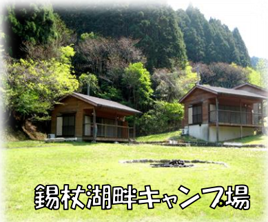
錫杖湖畔キャンプ場