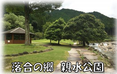
落合の郷 親水公園