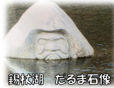
錫杖湖 だるま石像