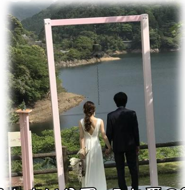
ふれあい公園 ふれ愛の鐘