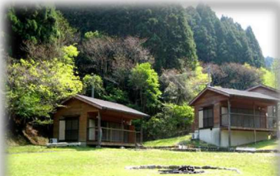
錫杖湖畔キャンプ場