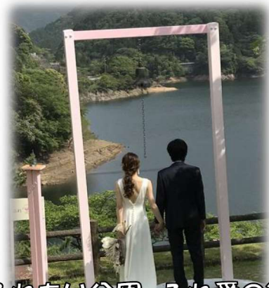
ふれあい公園 ふれ愛の鐘