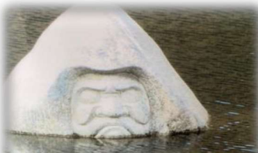
錫杖湖 だるま石像