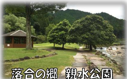
落合の郷 親水公園