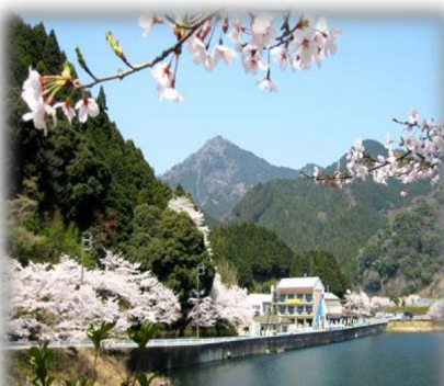
錫杖湖水荘 錫杖ヶ岳