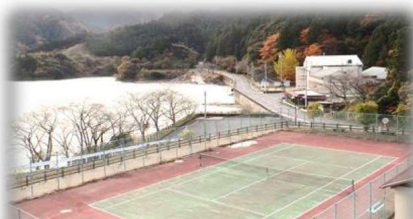
ふれあい公園 テニスコート